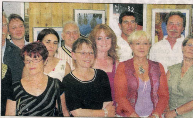
De nombreux photographes étaient présents, lundi soir, lors du vernissage de l'exposition